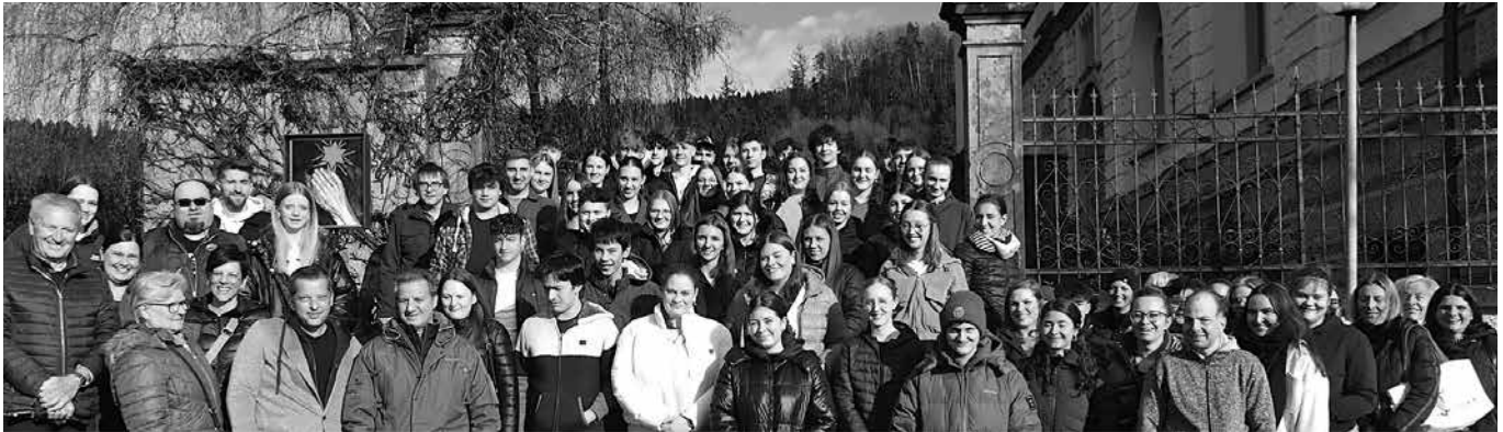
PatInnen und Firmlinge am Palmsonntag im Kloster Maria Stern