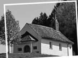
Hohenweiler Xaveriuskapelle Dank an Isolde Natter